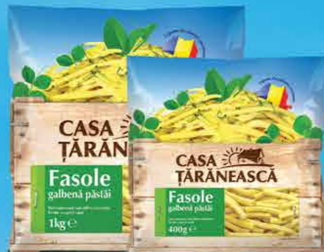
Fasole galbena pastai 20x400 gr Barcode: 5948626000866 10x1000 gr Barcode: 5948626003584