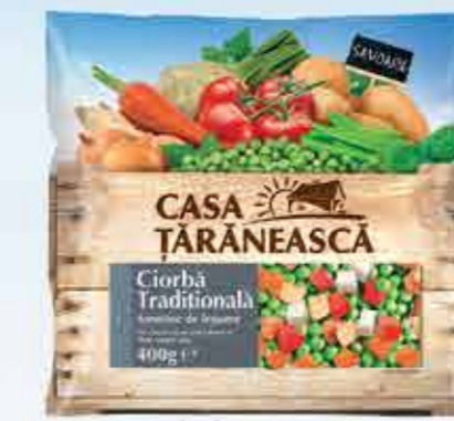
Amestec de legume pentru Ciorba Traditionala 20x400 gr Barcode: 5941884000869