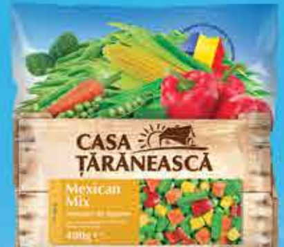
Amestec Mexican 20x400 gr Barcode: 5948626000712 10x1000 gr Barcode: 5948626002679 3x2,5kg Barcode: 5948626000552