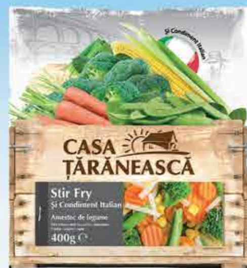
Stir Fry - Mix de legume si condiment italian 20x400 gr Barcode: 5941884001699