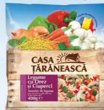
Amestec de legume si orez cu ciuperci 20x400 gr Barcode: 5948626005052