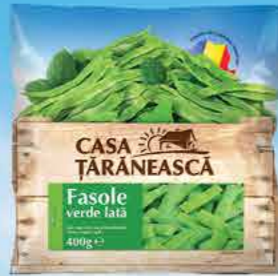
Fasole verde lata 20x400 gr Barcode: 5948626006349