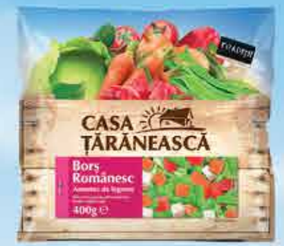
Amestec de legume pentru Bors Romanesc 20x400 gr Barcode: 5941884000845