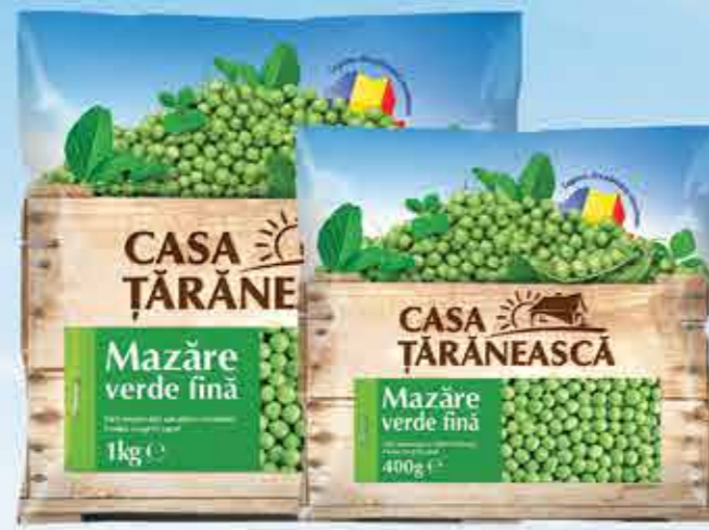
Mazare verde fina 20x400 gr Barcode: 5948626000699 10x1000 gr Barcode: 5948626002655 3x2,5kg Barcode: 5948626000545