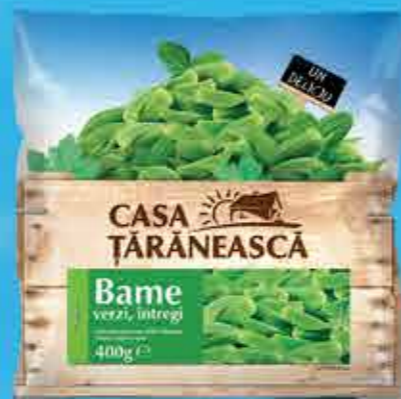
Bame 20x400 gr Barcode: 5948626002761