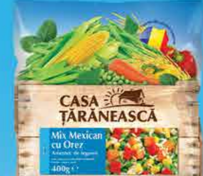
Amestec Mexican cu orez 20x400 gr Barcode: 5948626002709