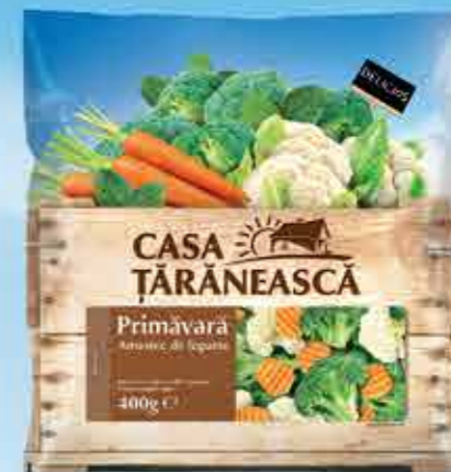
Amestec de legume de primavara 20x400 gr Barcode: 5941884001200