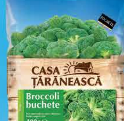
Broccoli buchete 20x400 gr Barcode: 5941884001187