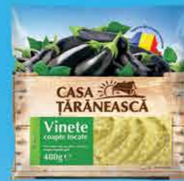
Vinete 20x400 gr Barcode: 5948626000682