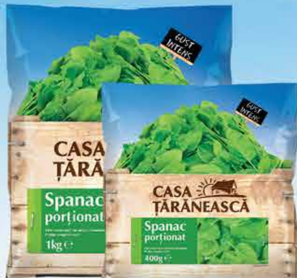
Spanac 20x400 gr Barcode: 5948626005243 10x1000 gr Barcode: 5948626002723