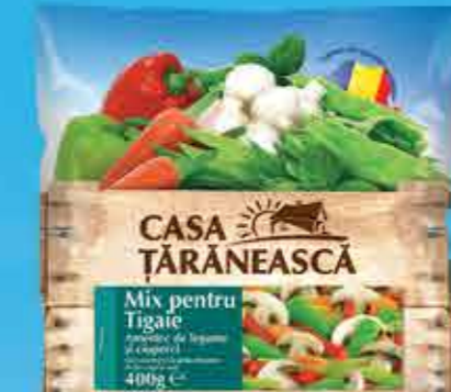
Amestec de legume cu ciuperci pentru tigate 20x400 gr Barcode: 5948626006332