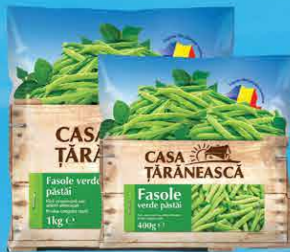
Fasole verde 20x400 gr Barcode: 5948626000705 10x1000 gr Barcode: 5948626002662 3x2,5kg Barcode: 5948626000569