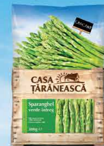
Sparanghel verde intreg 20x300 gr Barcode: 5941884001484