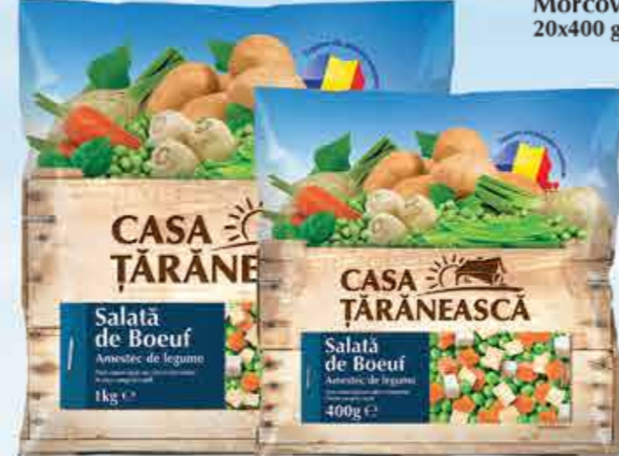
Amestec de legume pentru Salata Boeuf 20x400 gr Barcode: 5948626000811 10x1000 gr Barcode: 5948626002686