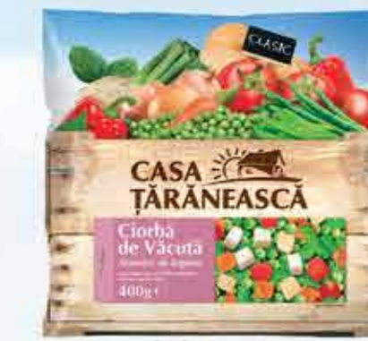
Amestec de legume pentru Ciorba de Vacuta 20x400 gr Barcode: 5941884000821