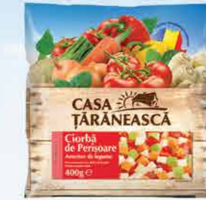
Amestec de legume pentru Ciorba Piesoare 20x400 gr Barcode: 5948626003836