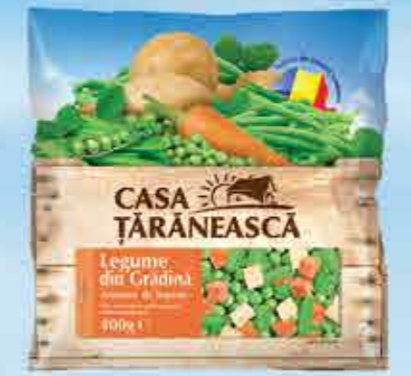
Amestec de legume de Gradina 20x400 gr Barcode: 5948626000743