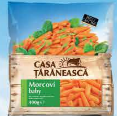
Morcovi baby 20x400 gr Barcode: 5941884001224