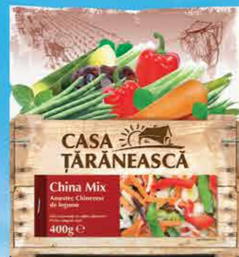
Amestec de legume chinezesc 20x400 gr Barcode: 5941884001675